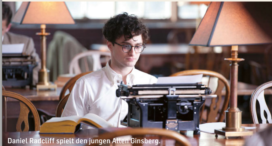
Daniel Radcliff spielt den jungen Allen Ginsberg.