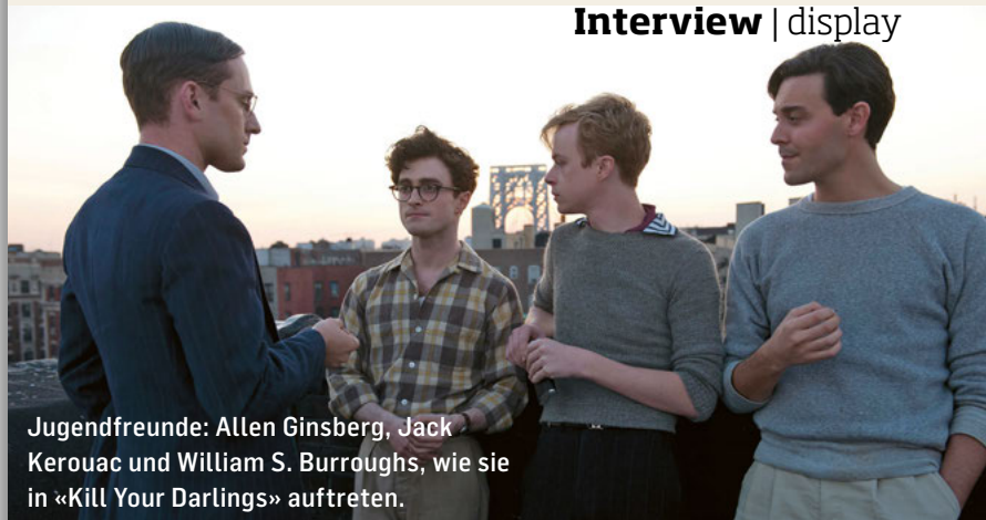
Jugendfreunde: Allen Ginsberg, Jack Kerouac und William S. Burroughs, wie sie in «Kill Your Darlings» auftreten.

GEMUNKEL RUND IM DANIEL · Daniel hat viele schwule Freunde, wie beispielsweise Autor und Schauspieler Stephen Fry. Natürlich entstanden da auch viele Gerüchte um seine Sexualität. «Ich kann nur schmunzeln über all die Begründungen», sagt Daniel, «einige behaupten, ich habe ein schwules Gesicht, andere, ich hätte eine schwule Stimme - was auch immer das sein soll. Aber es macht mir überhaupt nichts aus.» ■