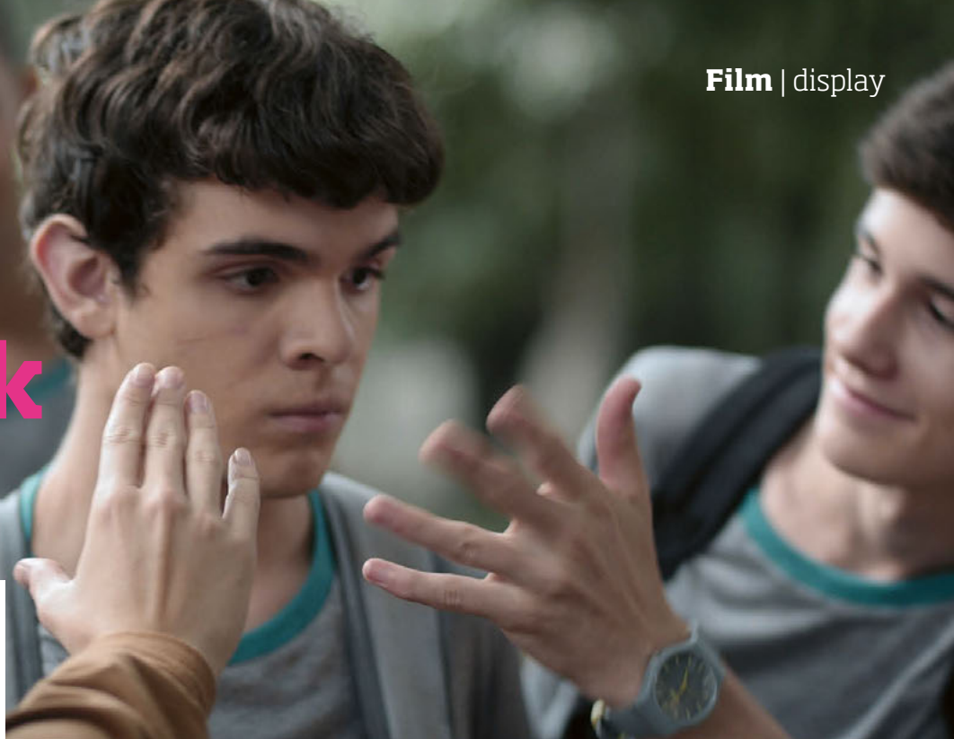
Blind und verliebt: Leonardo im brasilianischen Film «The Way He Looks».

Das Pink-Apple-Festival in Zürich und Frauenfeld zeigt eine breite Palette schwuler und lesbischer Filme.