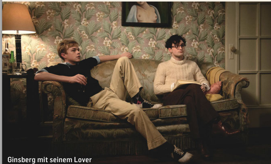
Ginsberg mit seinem Lover